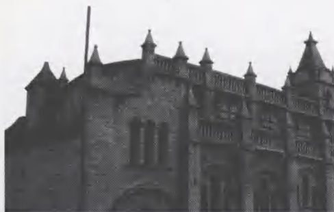
图2 延安桥儿沟天主教堂侧面