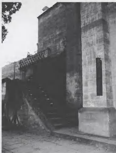
图7 佳县谭家坪天主教堂室外楼梯