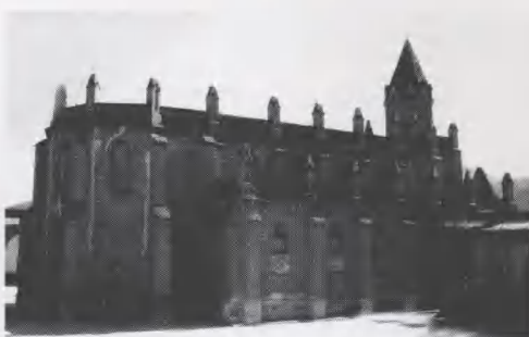
图3 延安甘谷驿天主教堂侧面