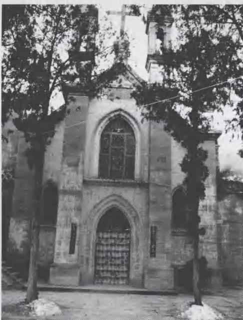
图6 佳县谭家坪天主教堂入口