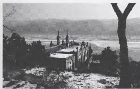
图5 佳县谭家坪天主教堂屋面

2)。室内装饰中西结合,中厅为券拱结构,侧廊与中厅以券柱式拱廊分隔。圣坛空间形式独特,上方覆盖着圆形穹顶,圣坛四周的细部石雕采用了传统的植物式样:梅、兰、菊、荷,及龙的动物式样。建筑材料下部用石材,其余为青砖。