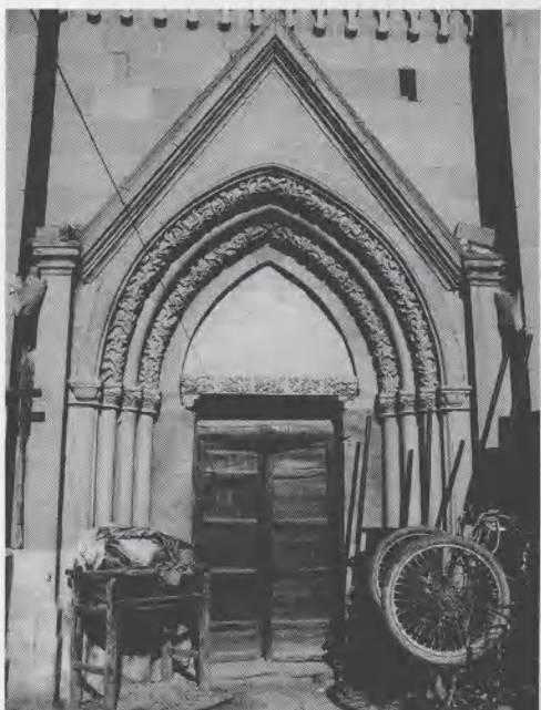
图4 延安甘谷驿天主教堂入口