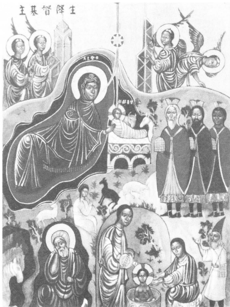
香港教區千禧年聖像畫