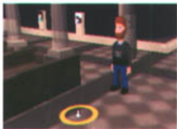
图1：将鼠标指向你想要去的地方，黄色光圈会在鼠标的上方，点击人物就会走过去。