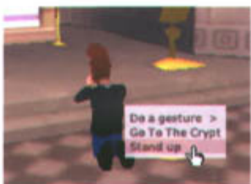
图4：从“下跪”转为“起立”