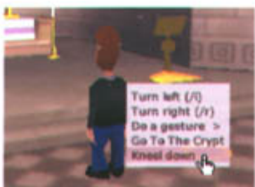
图3：右键点击人物会弹出菜单，指向做“Do a gesture”会弹出二级菜单你可以选择自己想做的动作，比如“鼓掌”、“挥手”、“下跪”等等。