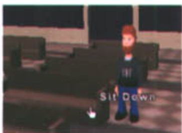
图2：将鼠标移动到椅子上就会出现“坐下”的提示，点击椅子人物就会走过去入座。