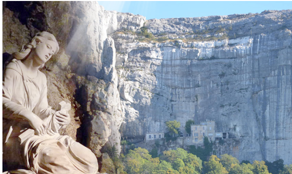
玛达肋纳隐居的法国圣波美的小山

1600 年,这些圣髑被放置在克莱门特八世送来的石棺中,其头颅被放置在一个单独的容器中。1814 年,在法国大革命期间遭到破坏的波美的拉斯特教堂被修复,1822 年,岩洞又重新奉献了。历经数代,圣人的头颅现在仍躺在那里,它曾经是那么多朝圣地的中心。