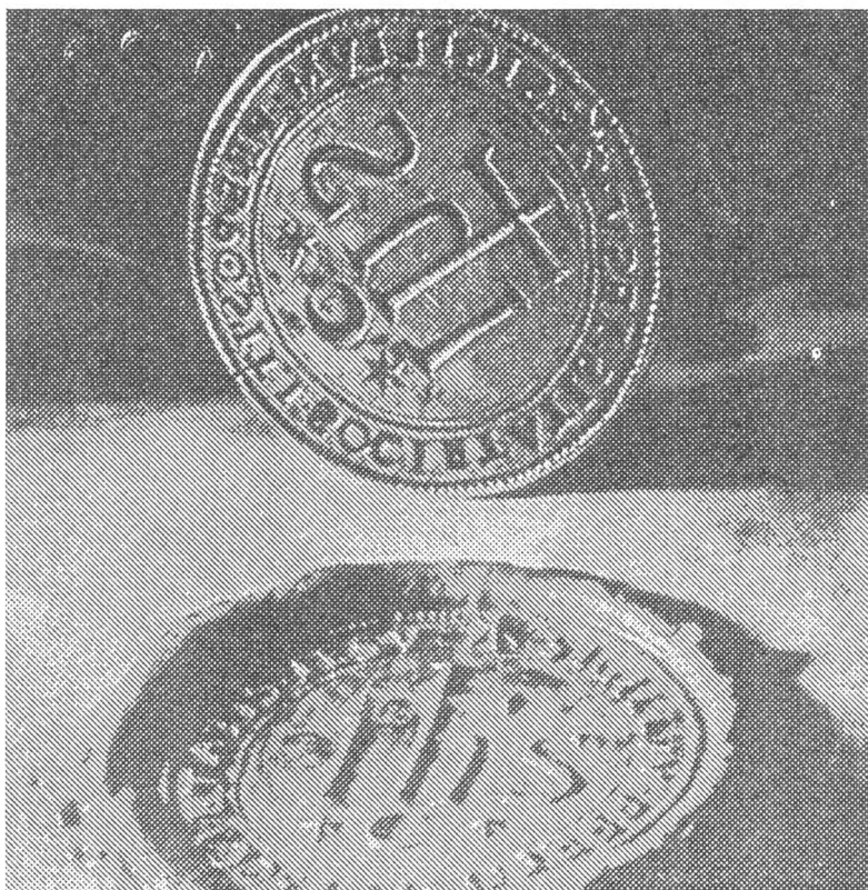
耶穌會總會長鈐印