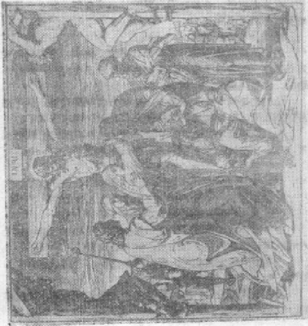
基督被钉死在十字架上