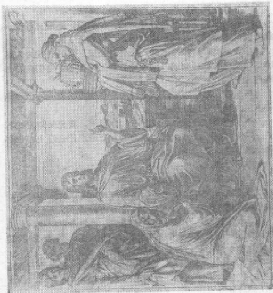
马大与马利亚姊妹，一个忙乱，一个清闲。