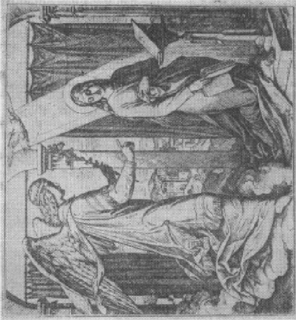
两个妓女争活婴，所罗门智断疑案。