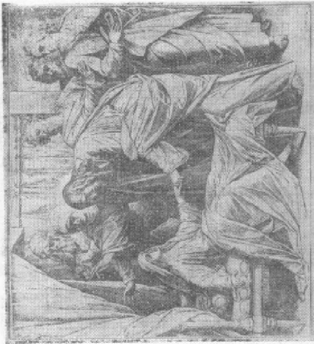
耶穌拉着少女的手說：『大利大吉來！』