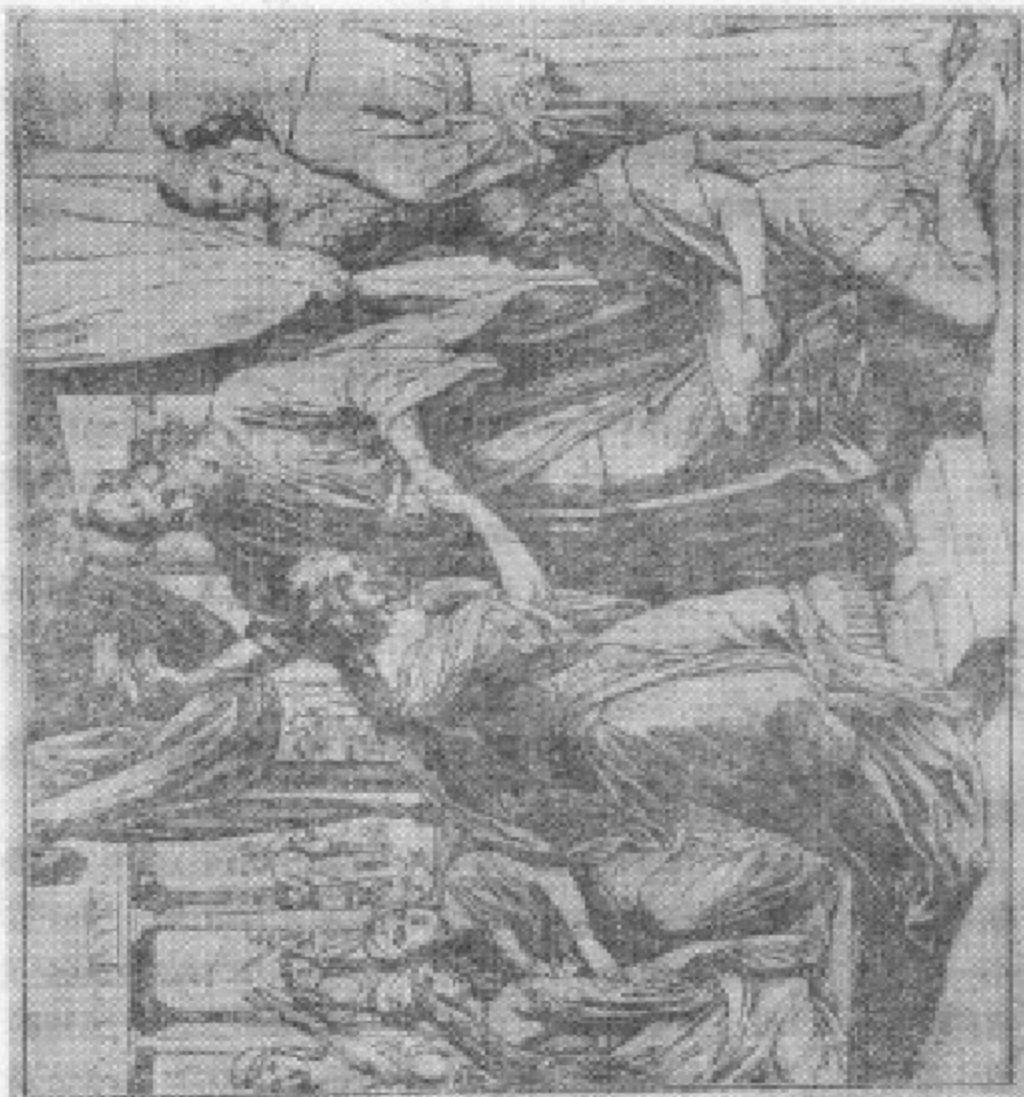
国王把王后的冠冕戴在伊斯帖的头上。