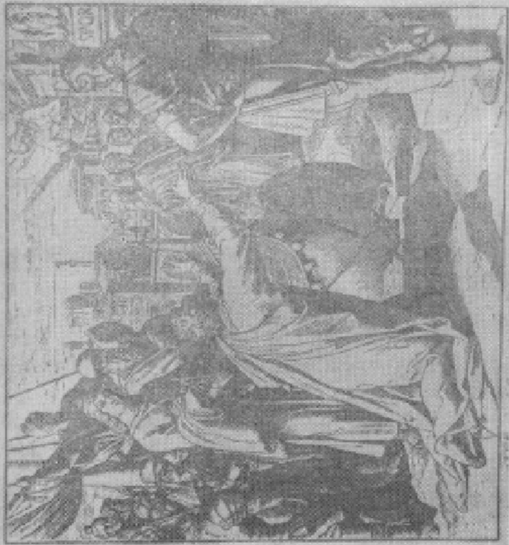
使徒保罗赴罗马，图图历险。