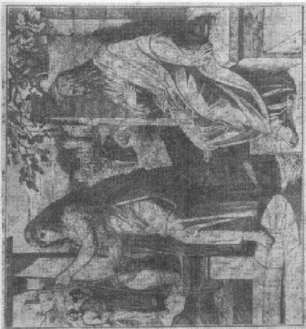
叙加城外古井旁，耶稣与撒玛利亚妇人论活水。