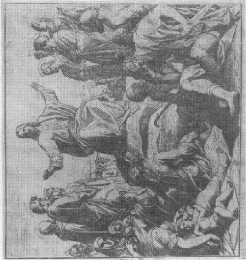
耶穌登山訓眾，視人八福。