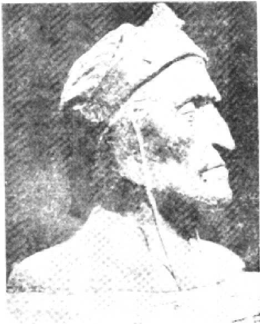
菲 丁 (十五世纪佚名艺术家的雕像)