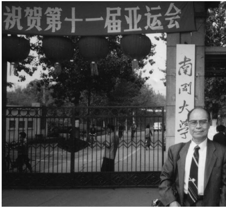
參觀亞運會時順赴天津訪問南開大學。