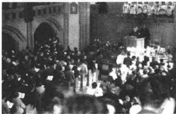
图二十 天主教弥撒礼,祭台后为唱诗班

礼 (Ablution),即司祭(神父)在弥撒献祭前准备穿祭服时,用清水洗手指;在举行正式祭献前,又于祭台边行洗手礼,边吁祷“天主”,以洁净其心身。这样,便可使所行祭献被天主所接纳,且避免手指接触圣饼时带上污秽;在弥撒结束前,司祭又在祭台右边用酒和水洗净拇指和食指,并喝下该酒水。因为仪式完结后手指上还沾有少量“食物”,这些是经过祝圣而变成基督的“圣体”和“圣血”的微