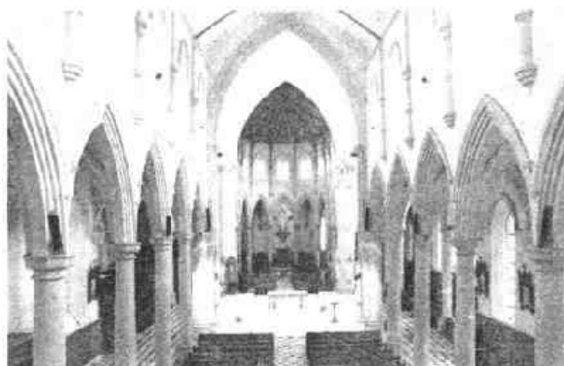
图三 教堂内装饰(香港圣母无原罪主教座堂)

教堂也称礼拜堂,它是基督徒进行宗教活动的建筑物。公元4世纪,基督教成为罗马帝国的国教后,即开始建造教堂。教堂的主要式样有拜占庭式、罗马式、哥特式和斯拉夫式。