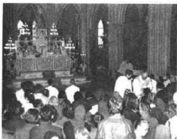
图二十一 天主教弥撒礼,信徒在领圣体

粒,如果留在手上将会遭到污秽,因而“净礼”意味着每一次弥撒中圣体和圣血全部都与基督徒结合在一起,绝不可有半点的玷污。