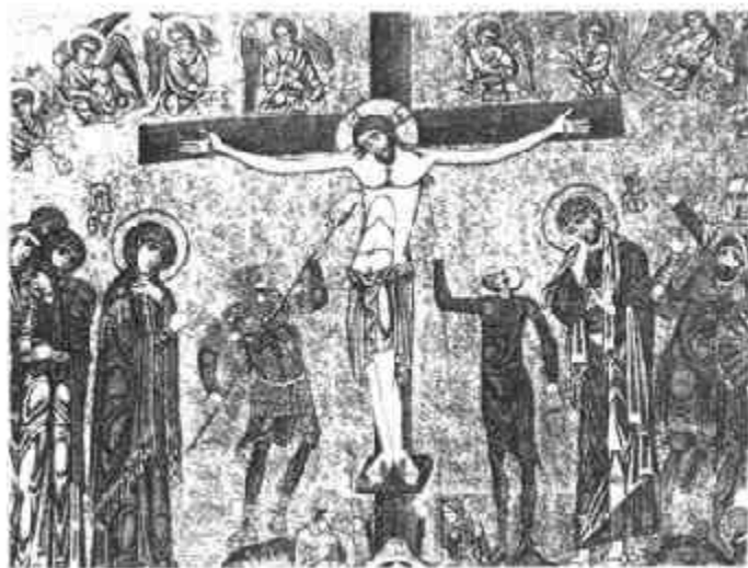
图二十六 威尼斯圣马尔谷 大殿, 13 世纪碎石镶嵌画

(3) 圣体礼仪及迁供圣品: 圣体即备饼酒(详见“圣体”部分)。念完经文以后, 主礼及辅祭隆重地将圣体恭迎到一特设的祭台或教堂内的小圣堂中, 在此供奉, 让信徒朝拜。礼仪结束后, 撤去祭台上的一切装饰和用具。