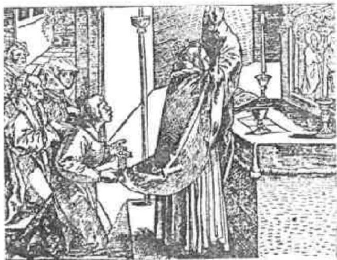
图三十 路德时代举行弥撒情形