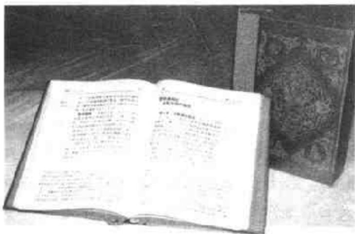
图十九 礼仪中宣读福音用的《福音书》