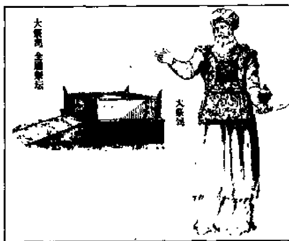
图二 大祭司及祭坛

祭司又称祭师，是沟通人与神关系的宗教专业人士。他们是人，生活于人间，知道人们的心愿和灾难；但他们还具有特殊的功能，知道神的启示而传达神谕，主持敬拜神灵的仪式和宗教活动，是人神的中介和沟通者。