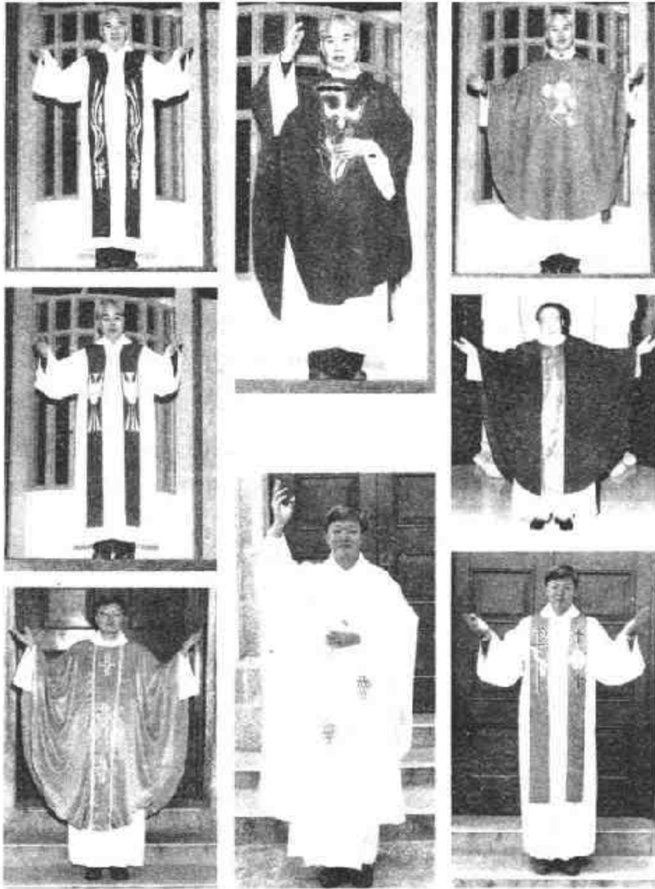
图七 不同节期穿用的祭衣 ①