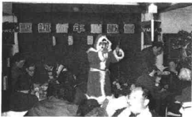
图二十四 中国基督教欢度圣诞节

教会承认12月25日为耶稣的誕生日,正好告诫信徒,耶稣是真正的“不败的太阳”,是世界之光。 ① 基督象征着太阳,寓意为世界之光进入充满了罪恶的黑暗世界,逐渐放出光芒,将驱逐黑暗。同时,引进对耶稣诞辰的崇拜,也正是对耶稣为天主之子信仰的一种合适的礼仪的表达。而且在庆祝圣诞的节日中,也将异教徒的习惯基督教化。因此,圣诞节不仅是宗教节日,也是