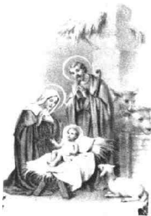
图二十五 圣诞马棚

首先在教堂合适地方安置“将临花园”,周边燃着四支蜡烛,圈中央用紫色布遮盖圣婴像;主礼身穿紫色祭衣,到祭台前,大家同唱“仰望教主歌”等将临歌曲,念祷词;主礼换上白色祭衣,唱“殉道圣者录”,然后与辅礼者走到将临花园旁;在“天使赞美曲”(如“光荣颂”等)歌声中,主礼揭去圣婴像的盖布,此时打开教堂内全部灯光。主礼向圣婴像献香,恭敬地捧着圣婴像至祭台,唱着圣诞歌曲。到祭台后,唱词为“用布包起来放在