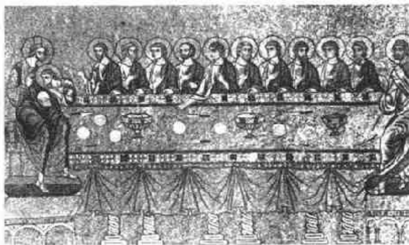
十一 主的晚餐(威尼斯圣马尔谷大殿十三世纪碎石镶嵌画)

信徒共食祭品的风俗在古代许多国家的宗教礼仪中都能见到，但基督教的圣餐在源流上主要是继承了犹太教的礼仪。