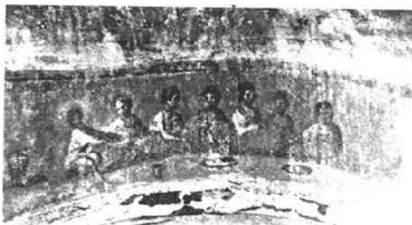
图八 早期教会的浸水洗

浸水洗(Immersion)在行礼时受洗者全身浸入水中或半身站在水里，头部须三次浸入水中，主礼者同时口诵规定的经文。基督教会认为，行浸礼的要点是：浸礼者应谨守《圣经》的遗训，遵上帝之命。早期基督教会在行注水礼外，也常举行这种仪式。8世纪以后，因为行浸礼不太方便，尤其是在冬天寒冷的季节行浸水礼对人的健康有所伤害，特别是对体弱病者不宜。于是拉丁教会行注水礼者日增，到12世纪，几乎全部用注水礼代替了浸水礼，注水礼成为洗礼仪式的主要形式。但是一些东部教会和新教的某些教派(如浸礼会)等仍沿用浸礼。