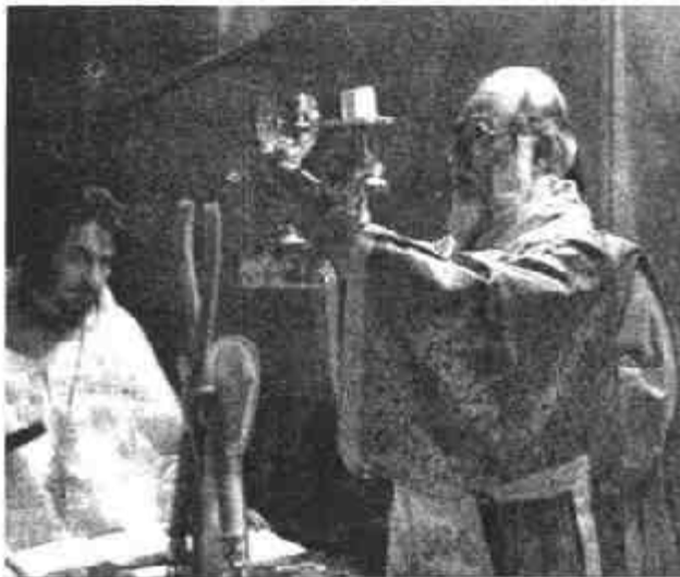
图二十七 东正教 复活节中的圣体血(圣餐)

复活节(Easter),亦译“耶稣复活瞻礼”、“主复活节”。基督教第二大节日,多数教派皆遵循,以纪念耶稣“复活”。据《圣经·福音书》记载:耶稣被钉死在十字架后第3日“复活”,这一天是“七日的头一日”(即安息日的第一天),因此基督教把这一天称为“主日”,以纪念耶稣复活,并逐渐用“主日”代替了原来的安息日,在“主日”举行崇拜活动,后来发展成现在的礼拜日。《圣经》上说耶稣复活的那一天是犹太教逾越节开始期间,即犹太教历尼散月(Nisan)第14日。尼西亚宗教会议规定了复活节的时间,即每年春分月圆后第一个星期日(如果月圆的这一天正好是“主日”,则复活节顺延一周),一般在3月21日至4月25日之间。16世纪西欧各国改用格列历后,东正教以及某些东方教会仍沿用儒略历,故东方教会的