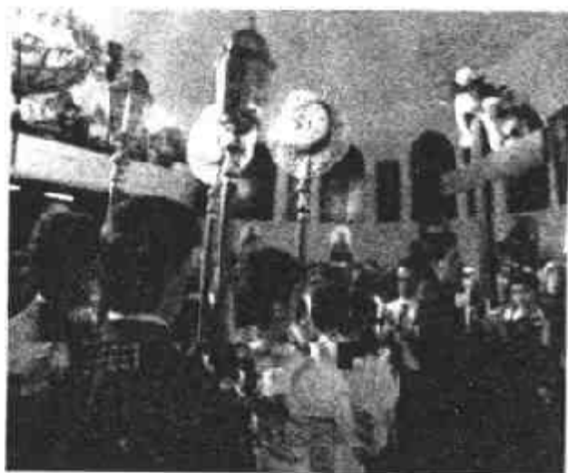
图二十八 东正教复活节庆典

纪念耶稣受难与复活的仪式后来传到其他东方教会和西方教会,于是各地教会在仪式中又引进了一些颇具地方色彩的礼仪习俗。